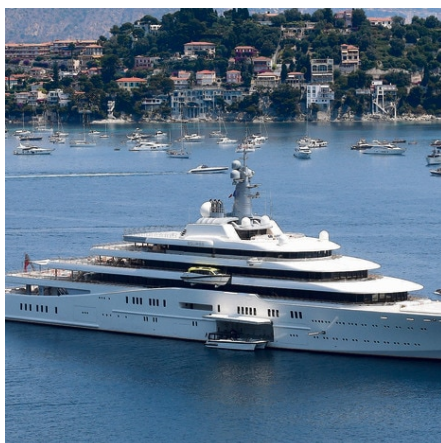
בים: היאכטה "אקליפס". אולם קולנוע ושתי בריכות שחייה

ב-2010 הצטייד ביאכטה "לונה", שגם אורכה 115 מטר, אך היא משוכללת הרבה יותר מקודמתה, ומחזיקה בין היתר בשיא עולמי לבריכה הגדולה ביותר המותקנת על יאכטה פרטית. גם היא נמכרה לאחרונה, לאיש העסקים הרוסי פארקאד אחמדוב, שנאלץ להיפרד ממנה זמן קצר אחר כך לטובת גרושתו.