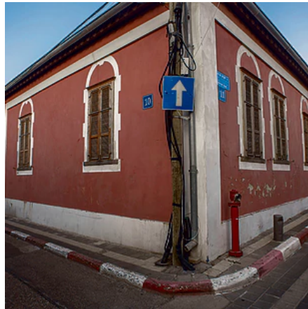
ביבשה: האחוזה בנווה צדק. תחרות צמודה עם טירת קוגן בקיסריה