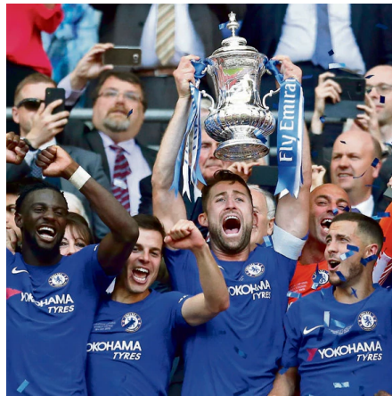
צ'לסי חוגגת את זכייתה בגביע האנגלי. בלט בהיעדרו: הבעלים אברמוביץ'

בשב"כ. זה לא רחוק מאבטחת ראש ממשלה", אומר מומחה בתחום, שעבד בעבר עם אוליגרכים רוסים. "אני מדבר על 6-8 מאבטחים שמלווים אותו בכל רגע, ומגיעים לפניו לכל מקום כדי לוודא שהשטח נקי. זה צוות של כ־30 איש, שיכול לעלות בסביבות ה־400 אלף שקל בחודש".