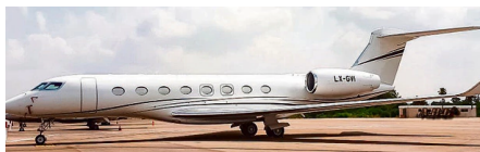
באוויו: מטוס המנהלים של אברמוביץ', השבוע בנתב"ג. יש לו גם בואינג 767

"עלות ההחזקה של שני מטוסים כאלה בלבד יכולה להגיע לכמה עשרות מיליוני דולרים בשנה – בעיקר על דלק ואנשי צוות", מסכם גורם בחברת "אירוהנדלניג", המספקת את שירותי הקרקע למטוסיו של אברמוביץ'.